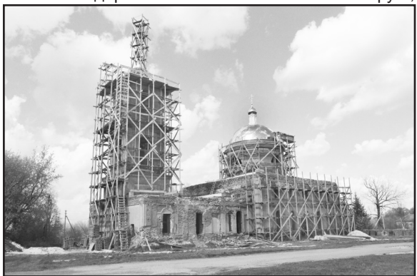
Май 2023 года

хоругви 4 металлические и 2 суконные стоимостью 100 руб., плащаница бархатная стоимостью 25 руб., кресты выносные деревянные 5 шт. стоимостью 50 руб., круг богослужебных книг 25 шт. стоимостью 80 руб., колокола 8 шт. стоимостью 6 400 руб.