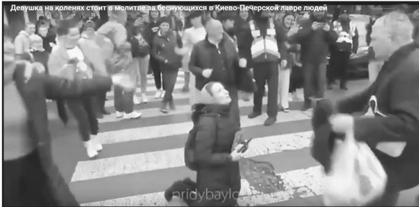
Девушка на коленях стоит и молится. Вокруг неё бесновались в Киево-Печерской лавре люди.