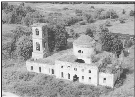
Фото С.Н. Белых, 2017 г.

медных стоимостью 120 руб., крест на престольный 2 серебряных и 1 медный стоимостью 85 руб., Евангелие 1 с серебряными крышками и 6 с медными стоимостью 300 руб., потир серебряный 5 шт. стоимостью 200 руб., дискос серебряный 5 шт. стоимостью 70 руб., священные блюда серебряные 10 шт. стоимостью 25 руб., звездница серебряная 5 шт. стоимостью 17 руб., ложка серебряная 4 шт. стоимостью 6 руб., светильники медные 30 шт. стоимостью 175 руб., паникадило медное 5 шт. стоимостью 470 руб., кадильница 1 серебряная и 2 медные стоимостью 27 руб., иконы (кроме находящихся в иконостасе) в раме под стеклом стоимостью 35 руб., в киотах без стекла 6 шт. стоимостью 500 руб., в рамках без стекла жестяные 8 шт. стоимостью 50 руб., без киота и без рам деревянные 30 шт. стоимостью 50 руб.,