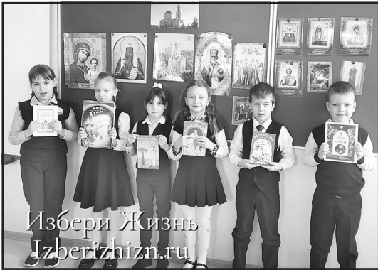
Избери Жизнь Izberizhizn.ru

11 школ района встретили или готовятся встретить у себя священников Русской Православной Церкви. Начал