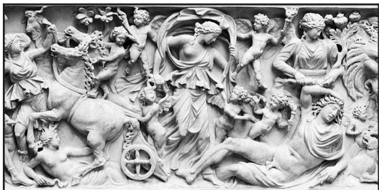
Саркофаг с мифом о Селене и Эндимионе

«Если кто-то болел и боялся умереть, он шел к писцу и просил его написать книгу заклинаний для загробной жизни. Писцу нужно было знать, какую жизнь прожил человек, чтобы догадаться, какое путешествие он может ожидать после смерти; так сказать, индивидуальный подход к нуждам клиента.