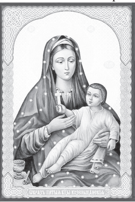
Божией Матери (1881).

24 воскресенье. Неделя 1-я Великого поста. Торжество Православия. Свт. Софрония, патр. Иерусалимского (639). Свт. Евфимия, архиеп. Новгородского, чудотворца (1458). Прп. Софрония, затворника Печерского, в Дальних пещерах (XIII). Прп. Алексия Голосеевского, Киевского (1917). Сщмчч. Пиония, пресв. Смирнского, и иже с ним (250). Перенесение мощей мч. Епимаха. Свт. Софрония, еп.