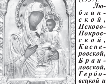
Барской икон Божией Матери.

Ап. от 70-ти Анании (I). Прп. Романа Сладкопевца (ок.556). Прп. Саввы Вишерского, Новгородского (1461). Мч. Домнина Солунского (IV). Прмч. Михаила, игумена Зовийского, и с ним 36-ти прмчч. (780-790). Прп. Иоанна Кукузеля (XIV). Празднование в честь Хитона Господня и Столпа Животворящего (Груз.). Равноап. Царя Иверского Мириана (после 361) и царицы Иверской Наны (ок. 364) (Груз.). Собор Молдавских святых. Сщмчч. Алексия Ставропольского пресв. (1918); сщмчч. Михаила Вологодского пресв. (1920); сщмчч. Александра Агафоникова, Георгия Архангельского, Николая Кулигина пресвв., мч. Иоанна Артемьева (1937).