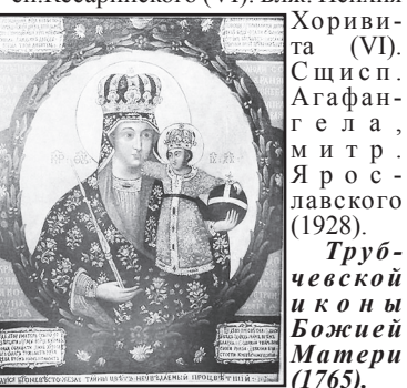
Иконы Божией Матери «Избавительница от бед» (Ташлинская) (1917).

16 четверг. Сщмчч. Дионисия Ареопагита, еп. Афинского, Рустика пресв. и Елевферия диакона (96). Прп. Дионисия, затворника Печерского, в Дальних пещерах (XV). Прп. Иоанна Хозевита, еп.Кесарийского (VI). Блж. Исихия Хоривита (VI).