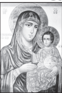
Иерусалимской (48), Ярославской (1642), Руденской (1687) и Калужской (1812) икон Божией Матери.